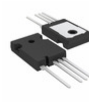
FGH40T120SMDL4 AMI Semiconductor / ON Semiconductor IGBT 1200V 80A 555W TO247-3