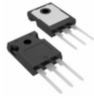
FGH40T65SHD-F155 AMI Semiconductor / ON Semiconductor IGBT 650V 80A 268W TO-247