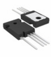
FGH40T120SMDL4 Fairchild/ON Semiconductor IGBT 1200V 80A 555W TO247-3