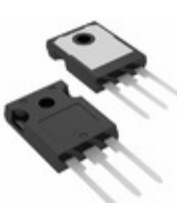
FGH40T65SH-F155 AMI Semiconductor / ON Semiconductor IGBT 650V 80A 268W TO-247-3