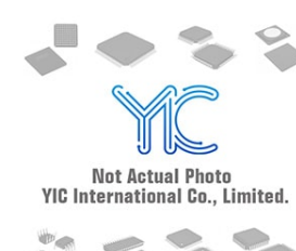
S-80945ALMP-DA9-T2 SEIKOEPSO S-80945ALMP-DA9-T2 SEIKOEPSO