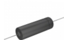
TC1265 Cornell Dubilier Electronics (CDE) CAP ALUM 100UF 250V AXIAL