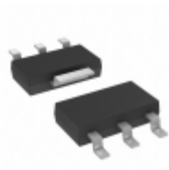
TC1264-3.3VDB Microchip Technology IC REG LDO 3.3V 0.8A SOT223-3