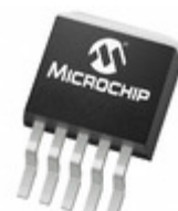
MCP1825-0802E/AT Microchip Technology IC REG LDO 0.8V 0.5A DDPAK