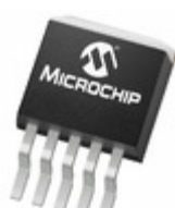
MCP1825-1802E/ET Microchip Technology IC REG LDO 1.8V 0.5A DDPAK