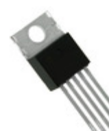
MCP1825-1802E/AT Microchip Technology IC REG LDO 1.8V 0.5A TO220-5