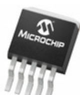
MCP1825-2502E/ET Microchip Technology IC REG LDO 2.5V 0.5A DDPAK