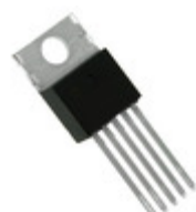
MCP1825-3002E/AT Microchip Technology IC REG LDO 3V 0.5A TO220-5