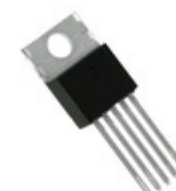
MCP1825-2502E/AT Microchip Technology IC REG LDO 2.5V 0.5A TO220-5