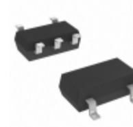
RT9069-50GB Richtek USA Inc. IC REG LDO 5V 0.2A SOT23-5