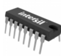
DG408DJ Intersil IC MULTIPLEXER 8X1 16DIP