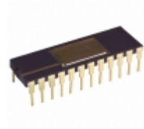
AD767SD/883B Analog Devices Inc. IC DAC 12BIT 24CERDIP