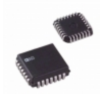
AD767KP Analog Devices Inc. IC DAC 12BIT W/AMP 28-PLCC