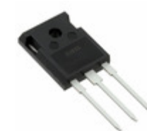
IXFH170N10P IXYS MOSFET N-CH 100V 170A TO-247