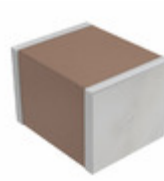
CGA6L2X7R1H105K160AD TDK Corporation CAP CER 1UF 50V X7R 1210