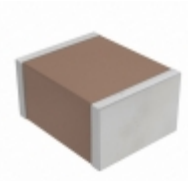
CGA6L2X7R1E335K TDK Corporation CAP CER 3.3UF 25V X7R 1210