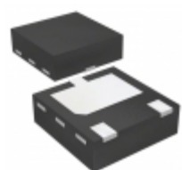
PBSS8510PA,115 Nexperia USA Inc. TRANS NPN 100V 5.2A SOT1061