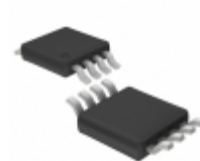
LT1494IMS8#PBF Linear Technology IC OPAMP GP 2.7KHZ RRO 8MSOP