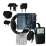
C8051F310DK Energy Micro (Silicon Labs) DEV KIT FOR C8051F310/F311