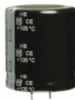
ECO-S2GB471EA Panasonic Electronic Components CAP ALUM 470UF 20% 400V SNAP