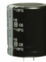
ECO-S2GB331DA Panasonic Electronic Components CAP ALUM 330UF 20% 400V SNAP