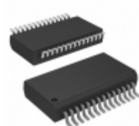
DSPIC33CK64MP502-E/SS Micrel / Microchip Technology 16 BIT DSC, 64KB FLASH, 8KB RAM,