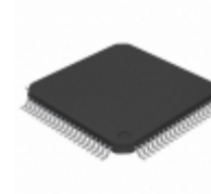
DSPIC33CK64MP208-I/PT Micrel / Microchip Technology 16 BIT DSC, 64KB FLASH, 8KB RAM,