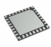
DSPIC33CK64MP502-I/2N Micrel / Microchip Technology 16 BIT DSC, 64KB FLASH, 8KB RAM,