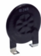
ERZ-C40CK621W Panasonic Electronic Components VARISTOR 620V 30A DISC 40MM