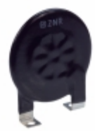
ERZ-C40CK781B Panasonic Electronic Components VARISTOR 780V 30A DISC 40MM