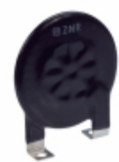
ERZ-C40CK751W Panasonic Electronic Components VARISTOR 750V 30A DISC 40MM