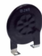
ERZ-C40CK681W Panasonic Electronic Components VARISTOR 680V 30A DISC 40MM