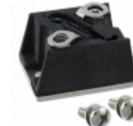
VS-T90RIA40 Electro-Films (EFI) / Vishay SCR PHASE CONT 400V 90A D-55