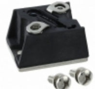
VS-T90RIA60 Electro-Films (EFI) / Vishay SCR PHASE CONT 600V 90A D-55