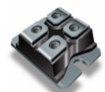
VS-UFB120FA20P Electro-Films (EFI) / Vishay DIODE GEN PURP 200V 60A SOT227