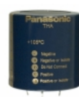
ECE-T1VA223EA Panasonic Electronic Components CAP ALUM 22000UF 20% 35V SNAP