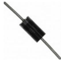
P6KE400A-G Comchip Technology TVS DIODE 342VWM 548VC DO15