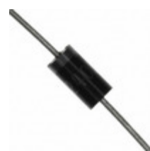
P6KE400A-HF Comchip Technology TVS DIODE 342VWM 548VC DO15