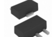
TC54VC3002EMB713 Microchip Technology IC VOLT DETEC CMOS 3.0V SOT89-3