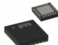
SY58621LMG-TR Microchip Technology TXRX 3.2GBPS CML/LVPECL 24-MLF