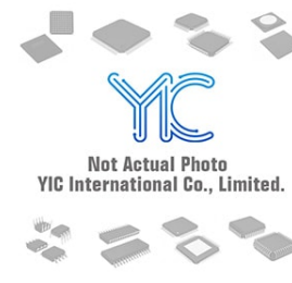
SY58620LMGTR MICROCH MICROCH 24-VFQF