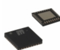
SY58626LMH-TR Microchip Technology IC TRANSMITTER 6.4GBPS 32-MLF