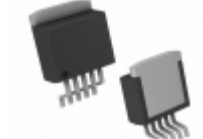
BD450M5WFP2-CZE2 Rohm Semiconductor IC REG LDO 5V 0.5A TO-263-5F