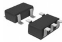
BD45232G-TR Rohm Semiconductor IC RESET OD 2.3V 200MS 5SSOP