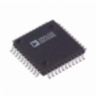
AD6600ASTZ-REEL Analog Devices Inc. IC ADC DUAL W/RSSI 44-LQFP