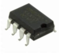
LIA135S IXYS Integrated Circuits Division IC OP AMP ISOLATION 10KHZ 8SMD