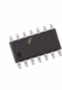
74VHC02SJ AMI Semiconductor / ON Semiconductor IC GATE NOR 4CH 2-INP 14SOIC