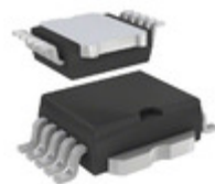
STV160NF02LAT4 STMicroelectronics MOSFET N-CH 20V 160A POWERSO-10