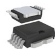
STV160NF02LT4 STMicroelectronics MOSFET N-CH 20V 160A POWERSO-10