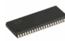
CY7C1041G18-15VXI Cypress Semiconductor Corp IC SRAM 4MB 15NS44SOIC