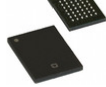
CY7C1041G30-10BVXI Cypress Semiconductor Corp IC SRAM 4MBIT 10NS 48VFBGA