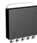
BA33C25HFP-TR LAPIS Semiconductor IC REG LDO 3.3V/2.5V 1A HRP5