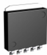
BA33C18HFP-TR LAPIS Semiconductor IC REG LDO 3.3V/1.8V 1A HRP5