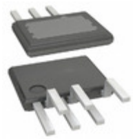
TOP261EG Power Integrations IC OFFLINE SWIT PROG OVP 7CESIP