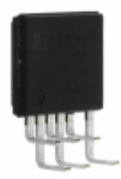
TOP259LN Power Integrations IC OFFLINE SWIT PROG OVP 7FESIP