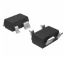
S-1009N35I-N4T1U SII Semiconductor Corporation VOLTAGE SUPERVISORY