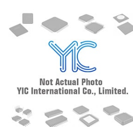
MIC29150-1.8WU MICREL MICREL TO-263