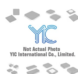
MIC29150-2.5BU Micrel Micrel TO-263