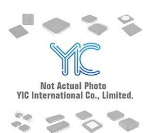
MIC29150-1.8WT MICREL MICREL TO-220