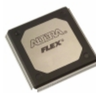
EPF10K50VRC240-3 Altera IC FPGA 189 I/O 240RQFP