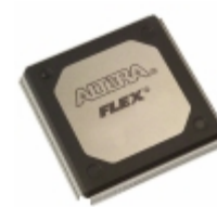
EPF10K50VRC240-4N Altera IC FPGA 189 I/O 240RQFP