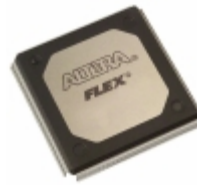
EPF10K50VRC240-4 Altera IC FPGA 189 I/O 240RQFP