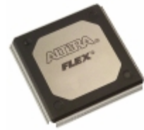
EPF10K50VRI240-4 Altera IC FPGA 189 I/O 240RQFP