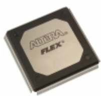
EPF10K50VRC240-1N Altera IC FPGA 189 I/O 240RQFP