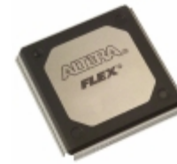
EPF10K50VRC240-2 Altera IC FPGA 189 I/O 240RQFP