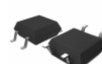
BU4833F-TR Rohm Semiconductor IC VOLT DETECTOR STD 4-SOP