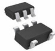
LD3985M27R STMicroelectronics IC REG LDO 2.7V 0.15A SOT23-5