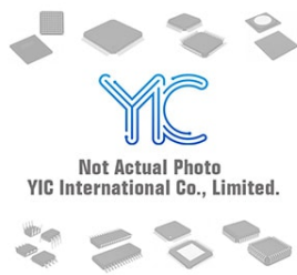
TLE7273-2EV50. INFINEON INFINEON SSOP14