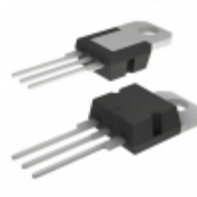
MIC29710-5.0BT Microchip Technology IC REG LDO 7.5A 5V TO220-3