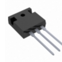
MIC29750-5.0BWT Microchip Technology IC REG LDO 5V 7.5A TO247-3