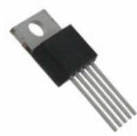
MIC29712WT Microchip Technology IC REG LDO 7.5A ADJ TO-220-5