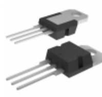
MIC29710-3.3WT Microchip Technology IC REG LDO 7.5A 3.3V TO220-3