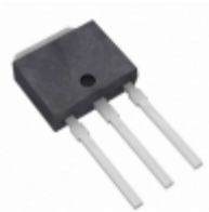
2SC4134T-E ON Semiconductor TRANS NPN 100V 1A TP