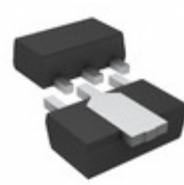
2SC4132T100Q Rohm Semiconductor TRANS NPN 120V 2A SOT-89