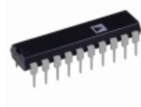
AD630KNZ Analog Devices Inc. IC MOD/DEMODO BAL 2MHZ 20- DIP