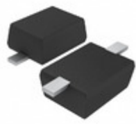
UDZVTE-172.4B Rohm Semiconductor DIODE ZENER 2.4V 200MW UMD2