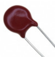
V47ZS1 Littelfuse Inc. VARISTOR 47V 250A DISC 7MM