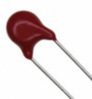
V47ZS05P Littelfuse Inc. VARISTOR 47V 100A DISC 5MM