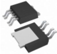
BAJ2CC0WFP-E2 Rohm Semiconductor IC REG LDO 12V 1A TO252-5