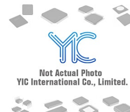
MIC5238-1.3YM5 V V SOT23-5