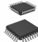
MC68HC908GZ8VFAA NXP USA Inc. IC MCU 8BIT 8KB FLASH 32LQFP