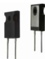
DSEI60-02A IXYS DIODE GEN PURP 200V 69A TO247AD