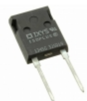
DSEI30-10AR IXYS DIODE GEN 1KV 30A ISOPLUS247