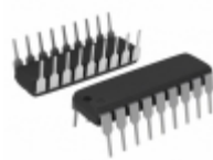
ADG529AKN Analog Devices Inc. IC MULTIPLEXER DUAL 4X1 18DIP