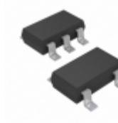
MIC5319-1.85YD5 Microchip Technology IC REG LDO 1.85V 0.5A TSOT23-5