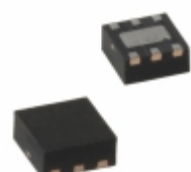
MIC5319-1.85YML-TR Microchip Technology IC REG LDO 1.85V 0.5A 6MLF