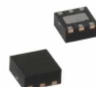
MIC5319-1.85YML-TR Microchip Technology IC REG LDO 1.85V 0.5A 6MLF