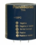
ECE-T2EA122EA Panasonic Electronic Components CAP ALUM 1200UF 20% 250V SNAP