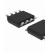
DS1077LZ-40+ Maxim Integrated IC OSC DUAL FX FREQ PROG 8SOIC