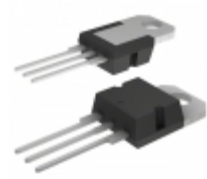
MIC39150-2.5WT Microchip Technology IC REG LDO 2.5V 1.5A TO220-3