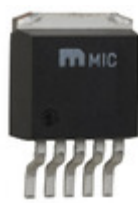
MIC39151-1.65BU TR Microchip Technology IC REG LDO 1.65V 1.5A TO263-5