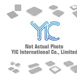
MIC39150-2.5BUTR MICREL MIC39150-2.5BUTR MICREL