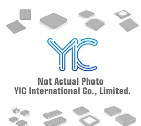
MIC39150-2.5WU TR MICREL MICREL TO-263