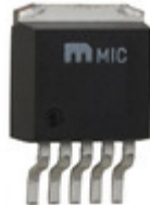
MIC39151-1.65BU Microchip Technology IC REG LDO 1.65V 1.5A TO263-5