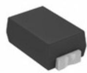
CDZT2RA4.7B Rohm Semiconductor DIODE ZENER 4.7V 100MW VMN2