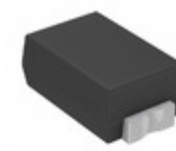
CDZT2RA5.1B Rohm Semiconductor DIODE ZENER 5.1V 100MW VMN2