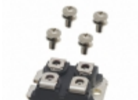
DMA150YA1600NA IXYS RECT BRIDGE GP 1600V SOT227B