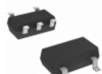
DMA201010R Panasonic Electronic Components TRANS 2PNP 50V 0.1A MINI5